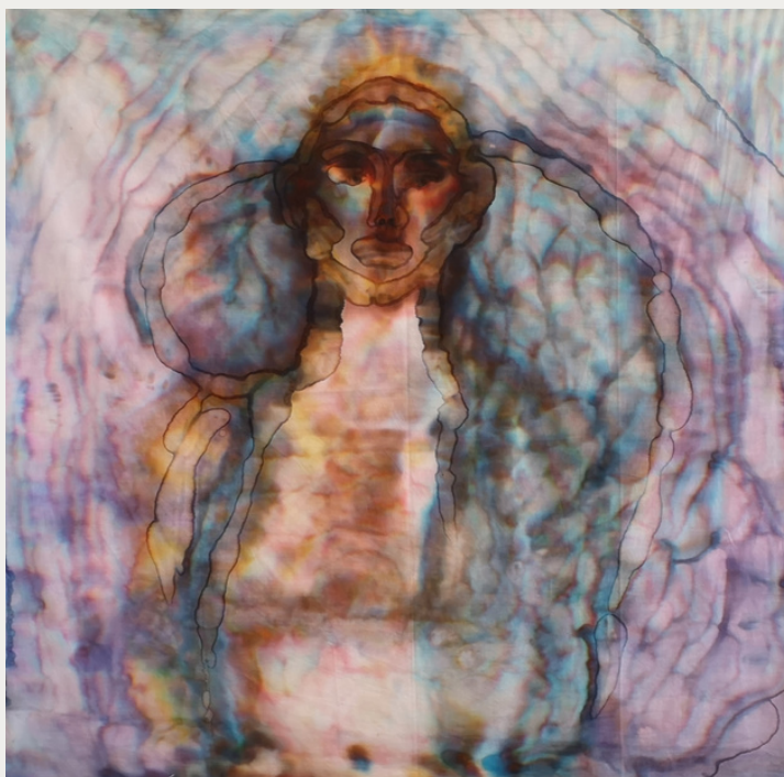
Giulia Apice, Doppelgänger , 2020, tecnica mista su lenzuolo, cm 155x154. © l'artista